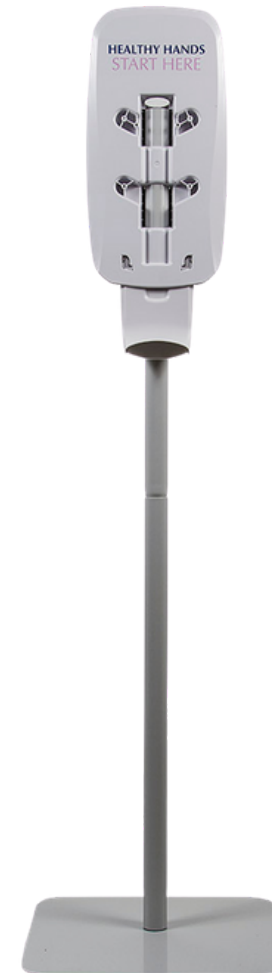
PEDASTAL DISPENSADOR DE GEL ANTIBACTERIAL O CON TERMÓMETRO