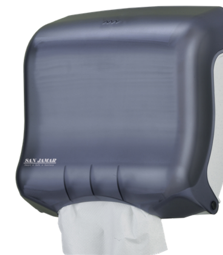
DISPENSADOR DE SANITAS