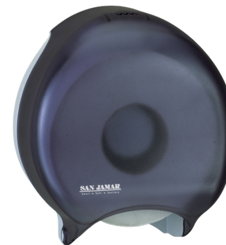
DISPENSADOR DE PAPEL HIGIÉNICO