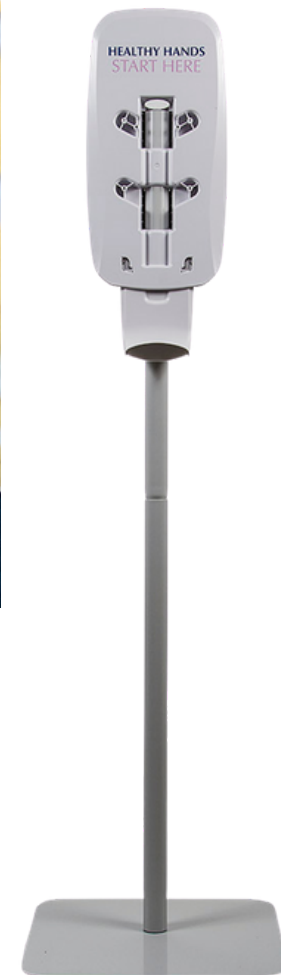
PEDASTAL DISPENSADOR DE GEL ANTIBACTERIAL O CON TERMÓMETRO

Gel base alcohol 70%, contiene humectante para las manos