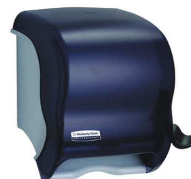
DISPENSADOR DE TOALLA EN ROLLO